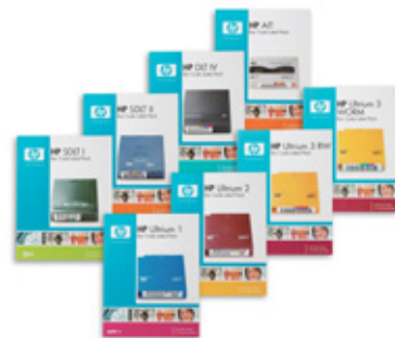
*包装可能更新，请以实物为准